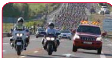
Seguridad Vial en la QH

Dentro de pocos días el 14 de noviembre en Huesca, y con motivo de las Fiestas del Barrio de San Martín de la capital oscense, se podrá asistir a la charla-coloquio de