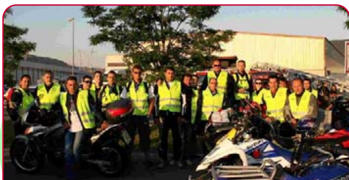
Los "moteros" voluntarios para cruces

La última charla que, de momento, está programada tendrá lugar en Getxo en abril de 2009 y está organizada por la Escuela Vasca del Deporte. Se tratan de unas Jornadas sobre organización de eventos deportivos. Una de las ponencias programadas tratará sobre "Quebrantahuesos, captación y gestión del voluntariado".