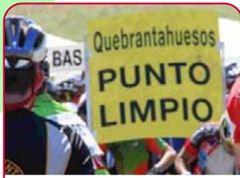
Punto limpio en la QH

Hace pocos días en la sala de conferencias de ERZENDESA de Zaragoza se celebraron las 4ª Jornadas de Senderismo y Naturaleza organizadas por Os Andarines d'Aragón. Una de las conferencias trató el tema "marcha Cicloturista Quebrantahuesos" enfocada principalmente a los esfuerzos que se realizan desde la organización a favor del respeto al medio ambiente, a través de las iniciativas de "No tires nada" y de la recogida de basuras realizando el recorrido a pie.