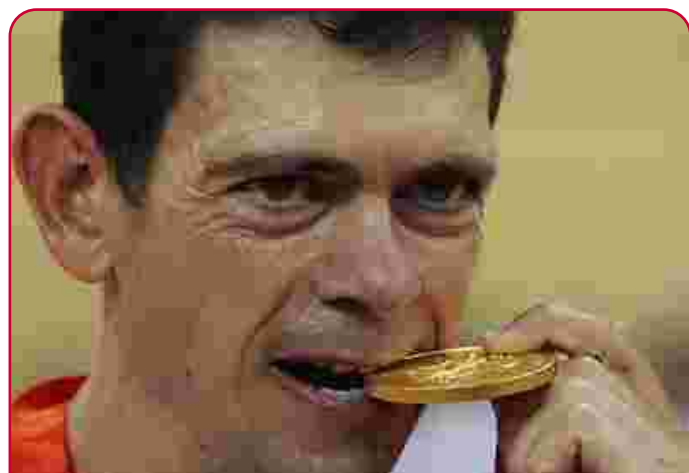
Oro en Pekín